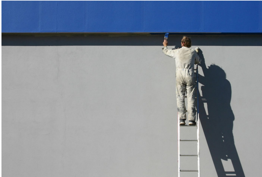
Schilder aan het werk

ken om onderdelen van het analytische model nauwkeuriger te modelleren. Dan vertaal je gedetailleerde microscopische informatie naar een meso- of zelfs macroscopisch niveau. Daarvoor moet dan wel eerst wat meer fysica in de computersimulatie worden gestopt.”